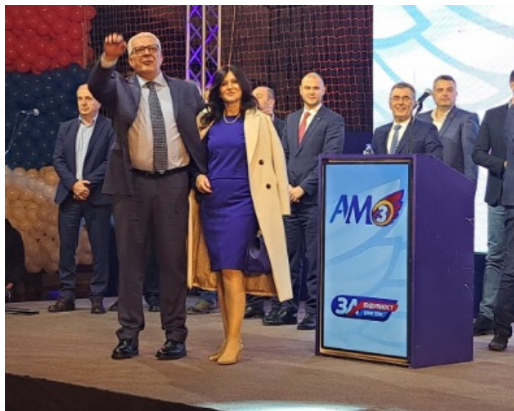
Obrázek 6

[1] https://www.novosti.rs/galerija/1214378/17979/mandic-konvenciji-uberanama-milo-kreirao-sistem-korupcije-organizovanog-kriminala-crnoj-gori?c=0