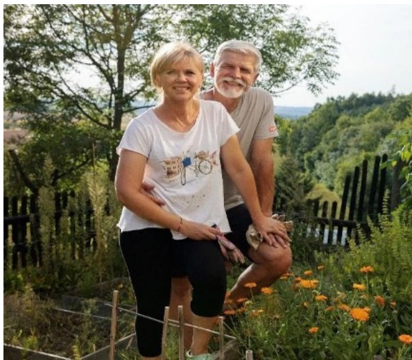
Obrázek 1  [1]

[1] Petr Pavel, "Nejmladší už nejsme, ale sluší nám to taky, ne?", Facebook, 13. prosince 2022, https://www.facebook.com/prezidentpavel/photos/pb.100063629803829.-2207520000./683833739947351/?type=3 .