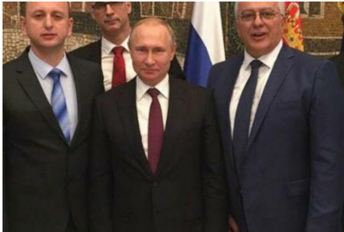
Obrázek 10

[vi] Keenneth Morrison a Vesko Garčević, "The Orthodox Church, Montenegro, and the 'Serbian World'," Atlantic Initiative, 2023. https://atlanticinitiative.org/wp-content/uploads/2023/02/SPC-WEB.pdf .