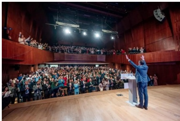
Obrázek 9 (Zdroj: Vijesti ) [i]

[i] https://www.vijesti.me/vijesti/politika/648170/milatovic-djukanovic-zna-da-gubi-gradjani-ce-mu-reci-zbogom