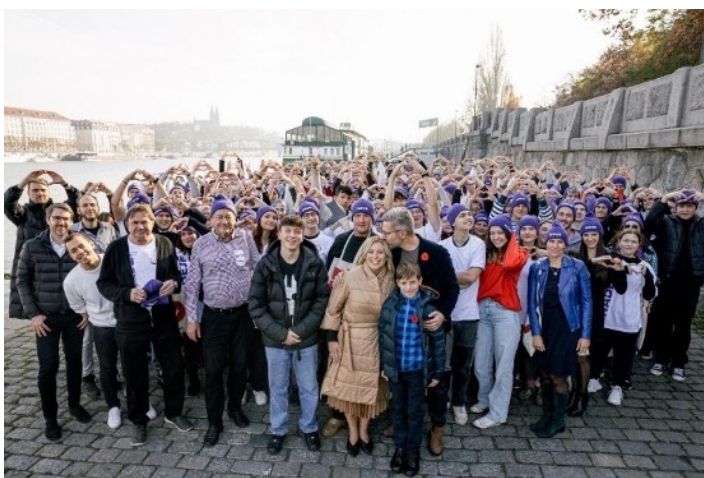
Obrázek 3

V podobném duchu se Danuše Nerudová snažila vizuálně prezentovat svou pozitivní a na budoucnost orientovanou kampaň. To obnášelo ve velké míře využití vizuálního obsahu, který měl navodit dobrou náladu. Kandidátka a další lidé zachycení na různých fotografiích a videích se často usmívali a vyzařovali optimismus. Pro zdůraznění svého moderního a progresivního přesvědčení byla Nerudová často zobrazována obklopená (většinou) mladými lidmi a ve společnosti své mladé a plně podporující rodiny (obrázek 3). Kandidátčini dva synové se ostatně postupně stali klíčovými aktéry kampaně a objevili se na řadě fotografií nebo dokonce v propagačních videích, čímž Nerudová ještě více zdůraznila svůj zájem na tom, aby budoucnost země byla nadějná (obrázek 4). Využití takových vizuálů mělo zároveň zdůraznit její ‚mateřské kvality‘, jak bylo možné pozorovat i na fotografiích a videích vyobrazujících kandidátku po boku starších lidí či při ‚běžných činnostech‘, jako například sběru hub. Tato strategie měla zároveň vyvážit kampaň zaměřenou na budoucnost snahou ukázat, že kandidátka klade stejný důraz i na přítomnost (podobně tomu bylo i diskurzivně).