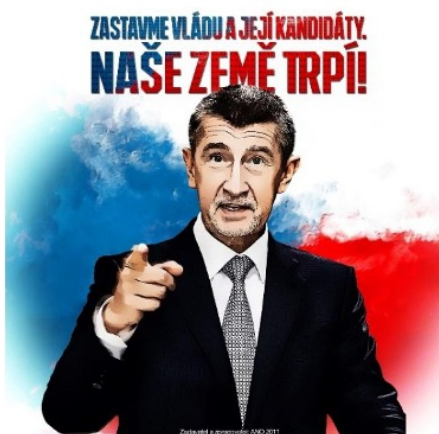
Obrázek 6 (Zdroj: Facebook)[1]

https://www.facebook.com/AndrejBabis/photos/pb.100044255628110.-2207520000./2701470286656265/?type=3 .