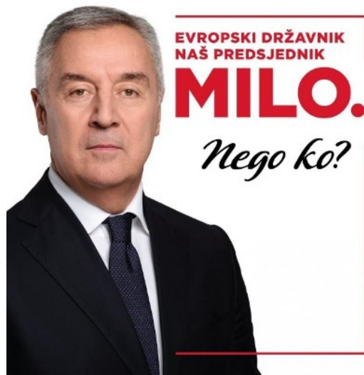
Obrázek 1 [1]

[1] https://www.antenam.net/politika/278086-djukanovicev-izborni-slogan-evropski-drzavnik-nas-predsjednik-milo-nego-ko