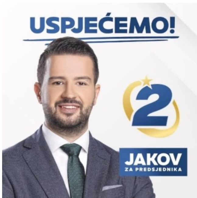
Obrázek 7 [1]

[1] https://www.istinomer.rs/analize/ko-je-jakov-milatovic-koji-tvr-di-da-ce-mila-poslati-u-penziju/