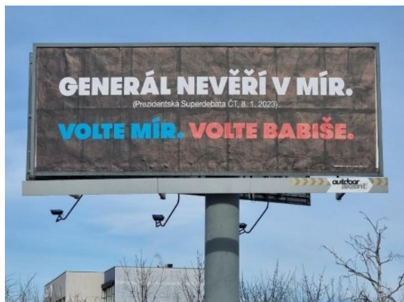
Obrázek 8 [i]