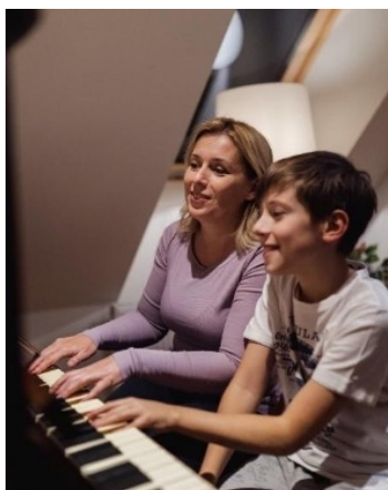
Obrázek 4

[1] Danuše Nerudová, "Vděk. Radost. Naděje!", Facebook , 13. listopadu 2022, https://www.facebook.com/photo.php?fbid=156185737119262&set=pb.100081835089629.-2207520000.&type=3 .