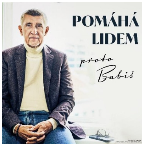
Obrázek 5[1]

Nesoulad v tónu a rétorice Babišovy kampaně dobře ilustruje i její vizuální stránka. Od počátku kampaně se Babišův tým snažil představit kandidáta v novém světle: navzdory jeho plamenné minulosti, poznamenané agresivním, rozdělujícím a často vulgárním vyjadřováním, byl Babiš najednou prezentován jako ‚nový člověk‘. Jediné, co údajně zbylo z jeho minulosti, bylo to, že „vždy pomáhal lidem“. Ve snaze zaujmout širší spektrum voličů tak kampaň zpočátku vsadila na snahu vizuálně vykreslit kandidáta jako mírného staršího muže (obrázek 5). S tím, že tato strategie nepřitáhla širší voličskou podporu nicméně kampaň postupně přešla k vizuální prezentaci lépe sladěnou s kandidátovou typicky negativní rétorikou. Po dvou měsících a jen pár dní před volbami Babišův tým přišel s novým designem, který vyobrazoval Babiše na pozadí české vlajky, hrozícího prstem a varujícího: „Zastavme vládu a její kandidáty. Naše země trpí!“ (obrázek 6). V jistém smyslu tak Babiš předznamenal svůj radikální obrat v průběhu druhého kola, neboť nový návrh až nápadně připomínal ten, který zvolil krajně pravicový kandidát Bašta (Obrázek 7).