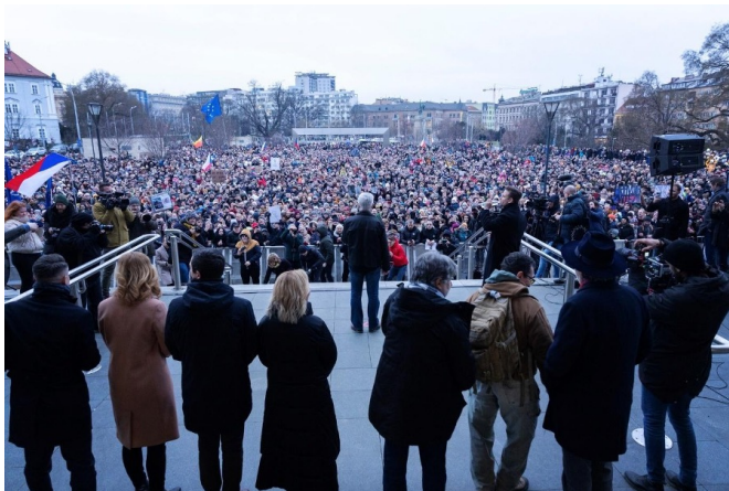
Obrázek 9 [i]

[iii] Vojtěch Vanda, "Trochu jiná zabijačka: Na předvolebním meetingu Andreje Babiše došlo na prejt i fyzické potyčky (Reportáž)," Refresher news , 24. ledna 2023, https://refresher.cz/129651-Trochu-jina-zabijacka-Na-predvolebnim-meetingu-Andreje-Babise-doslo-na-prejt-i-fyzicke-potycky-Reportaz .