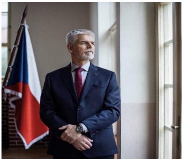
Obrázek 2 [1]

[1] Petr Pavel, "Nejmladší už nejsme, ale sluší nám to taky, ne?", Facebook, 13. prosince 2022, https://www.facebook.com/prezidentpavel/photos/pb.100063629803829.-2207520000./683833739947351/?type=3 .