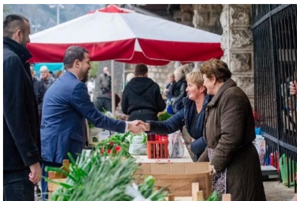
Obrázek 8 [1]

Stejně tak Milatovićova shromáždění se do značné míry lišila od shromáždění jeho soupeřů. Kandidátovy mítinky se odehrávaly bez vlajek, hudby nebo dalších symbolů příslušnosti k jedné národnostní skupině. Dělo se tak záměrně, aby bylo demonstrováno, že Milatović bude prezidentem všech občanů bez ohledu na jejich identitu. Na mítincích nevystupovalo mnoho řečníků, aby bylo demonstrováno, že Milatović je ústřední postavou, za níž nestojí žádná těžká stranická infrastruktura. Byl také jediným kandidátem, který navštívil veřejná prostranství a neplánovaně se vydával mezi voliče. Milatovićova kampaň byla navíc specifická tím, že udržoval přímou komunikaci se svými příznivci na sociálních sítích a byl velmi vstřícný a zdvořilý navzdory mnoha anonymním účtům snažícím se o jeho diskreditaci. Období před druhým kolem se pak vyznačovalo přítomností lídrů ostatních politických stran na jeho mítincích ve snaze vyslat poselství o jednotě v politické konfrontaci se stávajícím prezidentem.