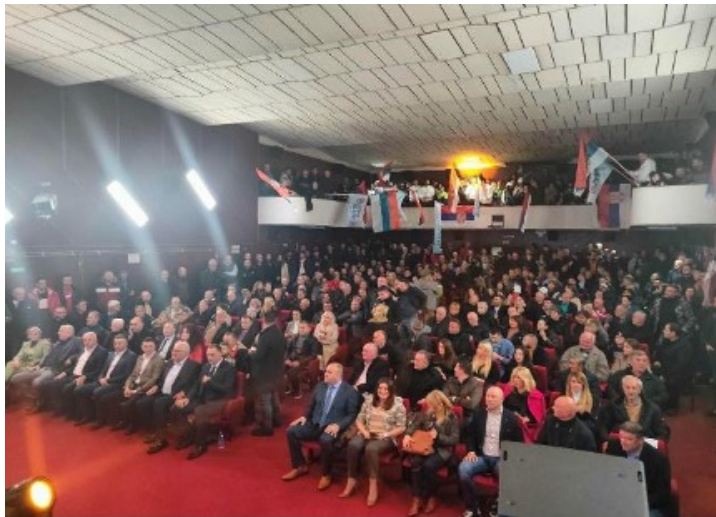
Obrázek 5 (Zdroj: Novosti [1] )

[1] https://www.novosti.rs/galerija/1214378/17979/mandic-konvenciji-uberanama-milo-kreirao-sistem-korupcije-organizovanog-kriminala-crnoj-gori?c=0