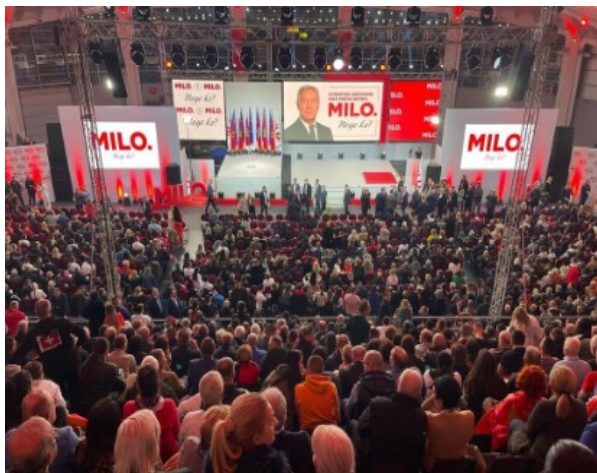
Obrázek 3 (Zdroj: Vijesti ) [1]

[1] https://www.vijesti.me/vijesti/politika/648249/djukanovic-na-završnoj-konvenciji-dvije-pobjede-kako-bi-utihnule-gluposti-o-velikoj-pobjedi-30-avgusta