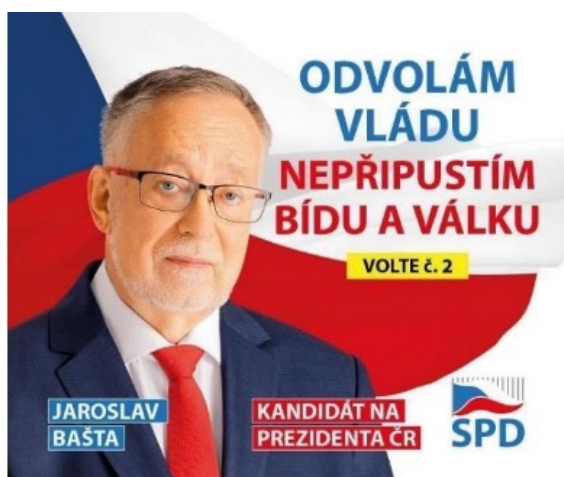
Obrázek 7 (Zdroj: spd.cz) [i]

[iii] Viz Petr Michl, "PR Klub i APRA odsuzují prezidentskou kampaň Andreje Babiše. Porušovala veškeré etické zásady komunikace," FOCUS-AGE, 31. ledna 2023, https://www.focus-age.cz/m-journal/aktuality/pr-klub-i-apra-odsuzuji-prezidentskou-kampan-andreje-babise--porusovala-veskere-eticke-zasady-komunikace__s288x16959.html .