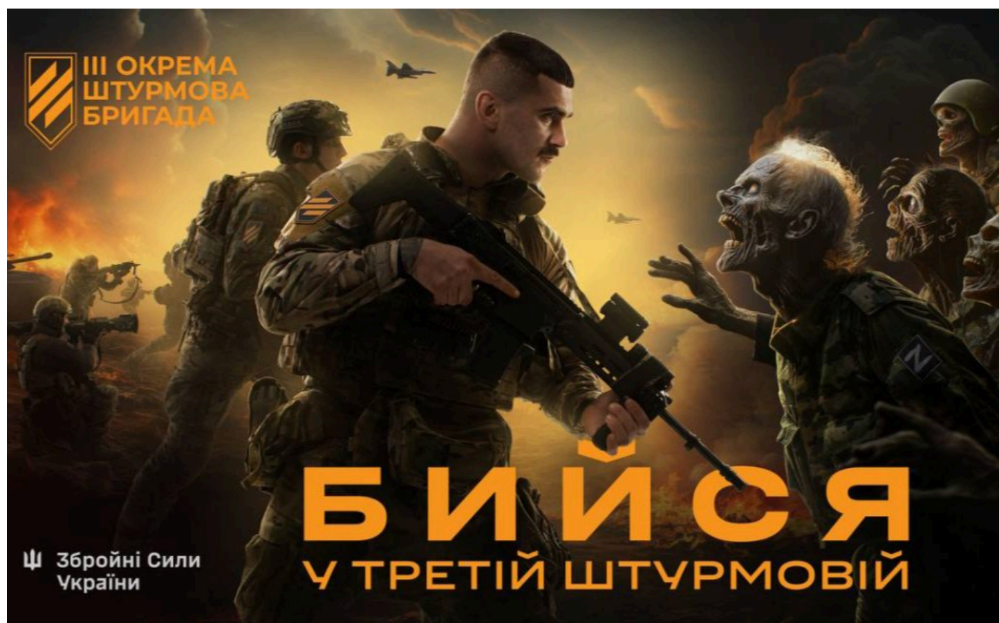
Obrázek 2: Mobilizační plakát třetí útočné brigády ozbrojených sil Ukrajiny, na kterém jsou ruští vojáci zobrazeni jako "zombie".

Pro vnějšího pozorovatele je také zajímavé sledovat, k jakým rétorickým změnám došlo pod vlivem války. Již v prvních dnech války se pro označení ruských vojáků hojně používal výraz "skřeti", který znamenal zlé mytologické bytosti. Tak byl převzat určitý narativ z fantasy literatury, zejména ze série Pán prstenů, kde hrdinové Dobra stojí proti hordám zlých orků. Ujaly se i další výrazy, jako "raši" (ruští fašisté), "kacapi" (historický pejorativní výraz pro Rusy), "zombie" (používaný pro označení nevytvořených a neorganizovaných mas ruských vojáků) a mnoho dalších. Odlišnění nepřítele je patrné v celé společnosti. Příkladem může být billboard zobrazující ukrajinského vojáka bojujícího s ruskými zombie .