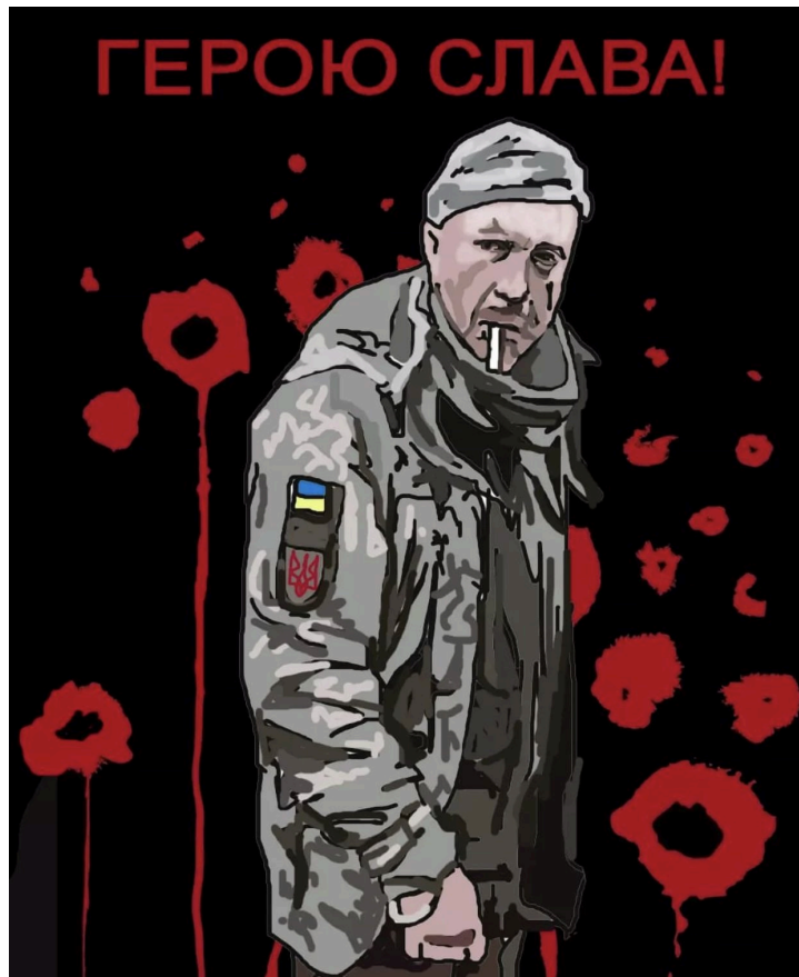
Obrázek 1: Obrázek ukrajinského vojáka z virálního videa, který byl popraven ruskými silami poté, co řekl "Slava Ukrayini".

příkladem je video, na němž je neznámý řadový ukrajinský voják zajat a popraven ruskými bojovníky poté, co bezvýrazně prohlásí: "Sláva Ukrajině". Toto video mělo obrovský mediální dopad jak na samotné Ukrajince, tak i v zahraničí.